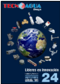
CATALOGO SEPTIEMBRE 2024 PDF