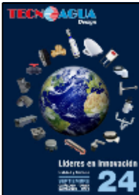
CATALOGO SEPTIEMBRE 2024 PDF